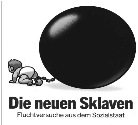
Abbildung 3: Sozialstaat als Ausbeuter?