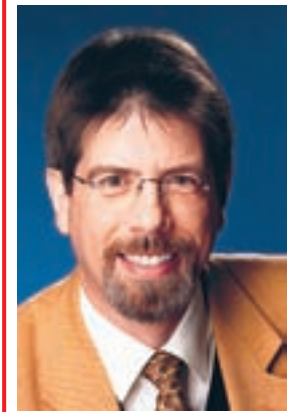
von Gernot Grumbach

Das Urteil zu den Studiengebühren des hessischen Staatsgerichtshofs hinterlässt Erstaunen. Mit 6 zu 5 Richtern entschied er, dass eine Vorschrift für kostenfreien Unterricht Studiengebühren für alle dennoch nicht ausschliesse. Ist das im Umgang mit der deutschen Sprache schon mutig, so ist das gewählte Argument noch verwegener: Ein völlig mittelloser Student habe ja Anspruch auf einen Kredit in der Höhe der Studiengebühren, damit sei seine Leistungsfähigkeit hergestellt.